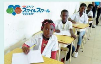
募金はアンゴラの小学校の給水施設の建設や衛生教育支援などにいかされています。

コアノンロールは「コナンスマイルスクールプロジェクト」に取り組むエシカル商品です。全国のコアノンロールを作るメーカーの「商品を通じて社会貢献ができないだろうか?」という声からスタートしました。組合員のみなさんのご利用により、2010年からの合計金額で6,900万円以上の募金をおくることができました。